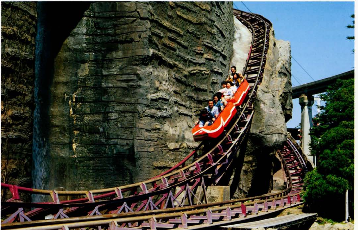
◆ポップスレー (奈良ドリームランド)