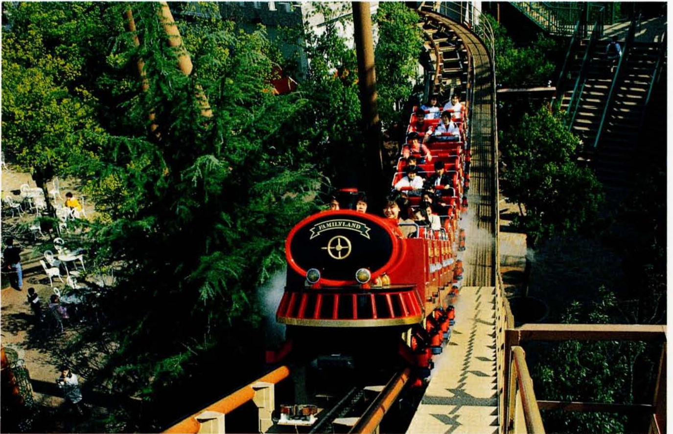
◆ビッグワン (宝塚ファミリーランド)