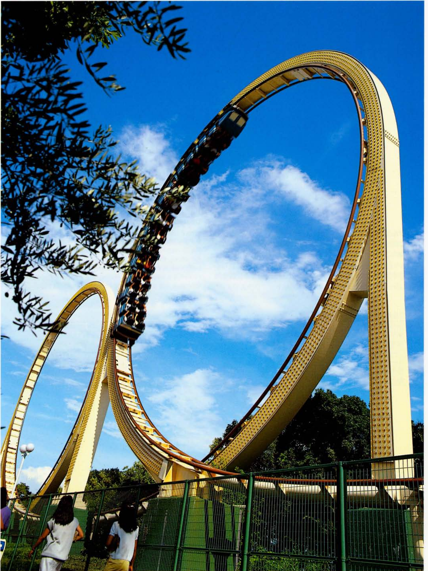
◆ダブルループ (神戸ポートピアランド)