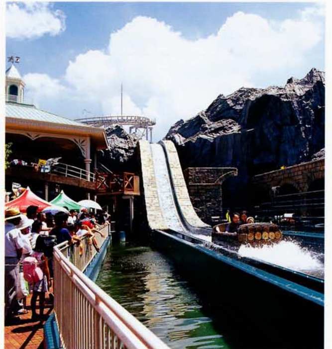
◆フラーナングフォール(倉敷チボリ公園)