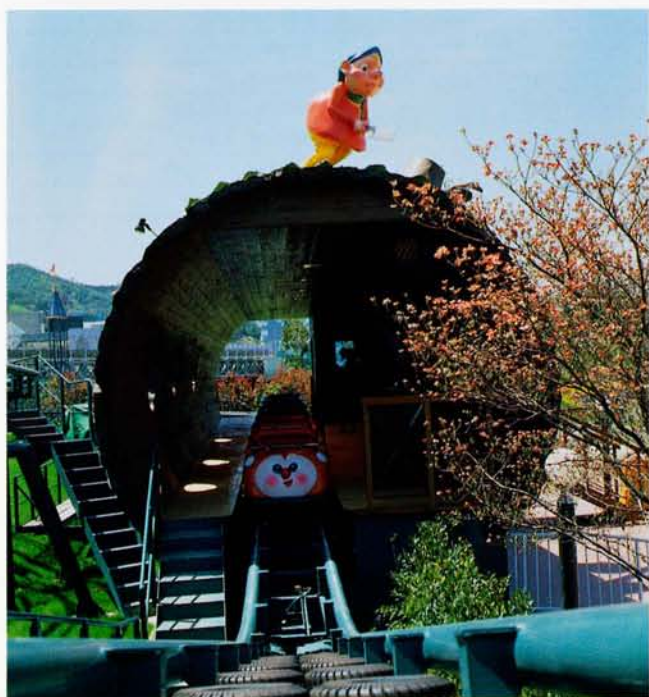
◆レディバードコースター (レオマワールド)