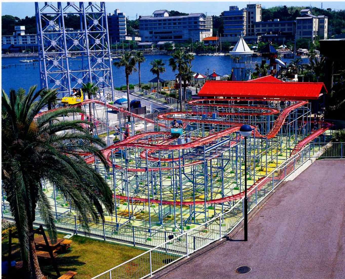
◆ジャングルマウス (浜名湖パルパル)