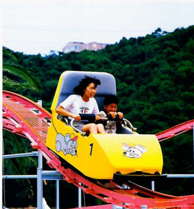
◆ジャングルマウス (浜名湖パルパル)