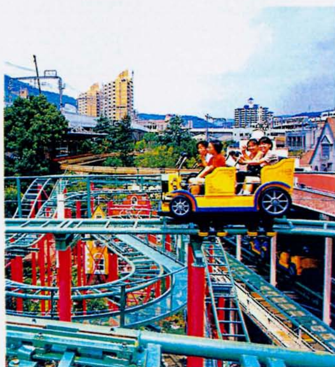
◆スキップコースター「こわこわカー!？」(宝塚ファミリーランド)