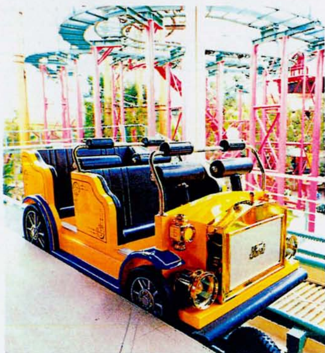
◆スキップコースター「こわこわカー!？」(宝塚ファミリーランド)