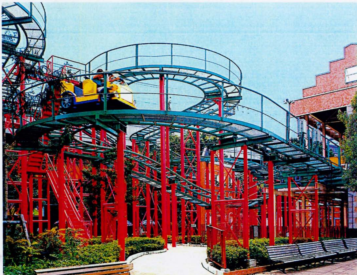
◆スキップコースター「こわこわカー!？」(宝塚ファミリーランド)