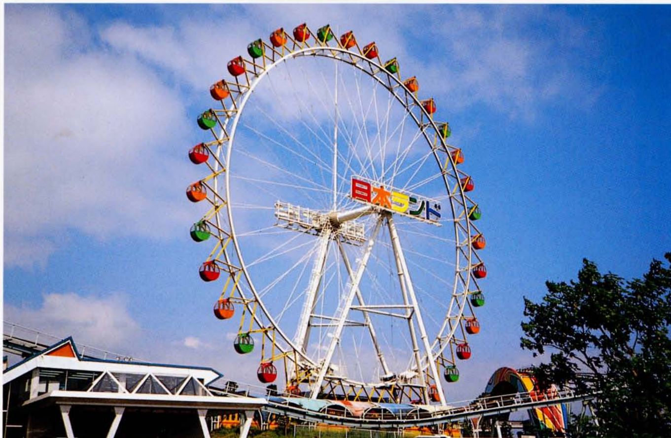
◆大観覧車 (日本ランド)