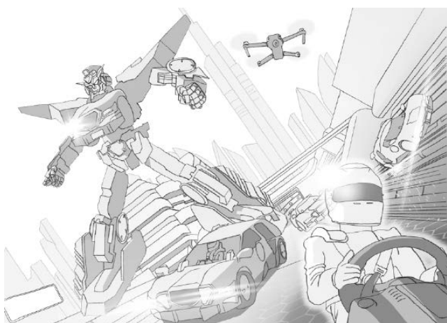
例 1：変形するゴーカート