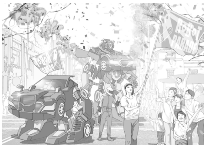
例 2：園内パレードでの変形デモンストレーション

※外装、デザインに関しては、アミューズメントパーク側のニーズに合わせて調整することが可能です。 ※上記イラストは、コンセプト説明のためのイメージとなります。