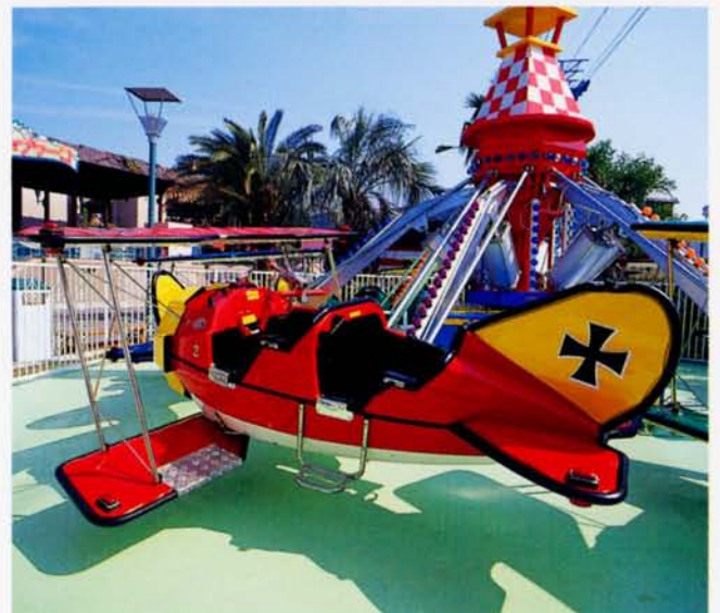
◆レッドバロン (浜名湖パレパレ)