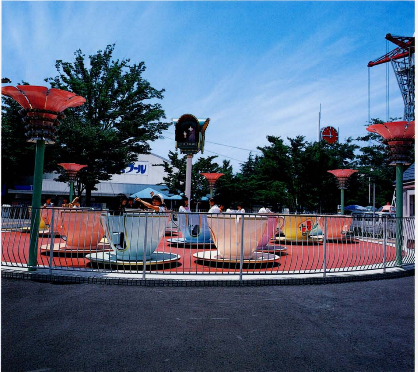
◆ティーカップ (ナガシマ スパランド)