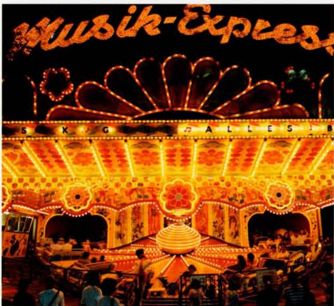
◆ミュージックエクスプレス (生駒山上遊園地)