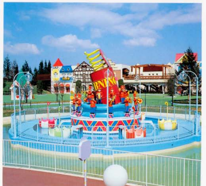
◆ターニングフロート (レオマワールド)