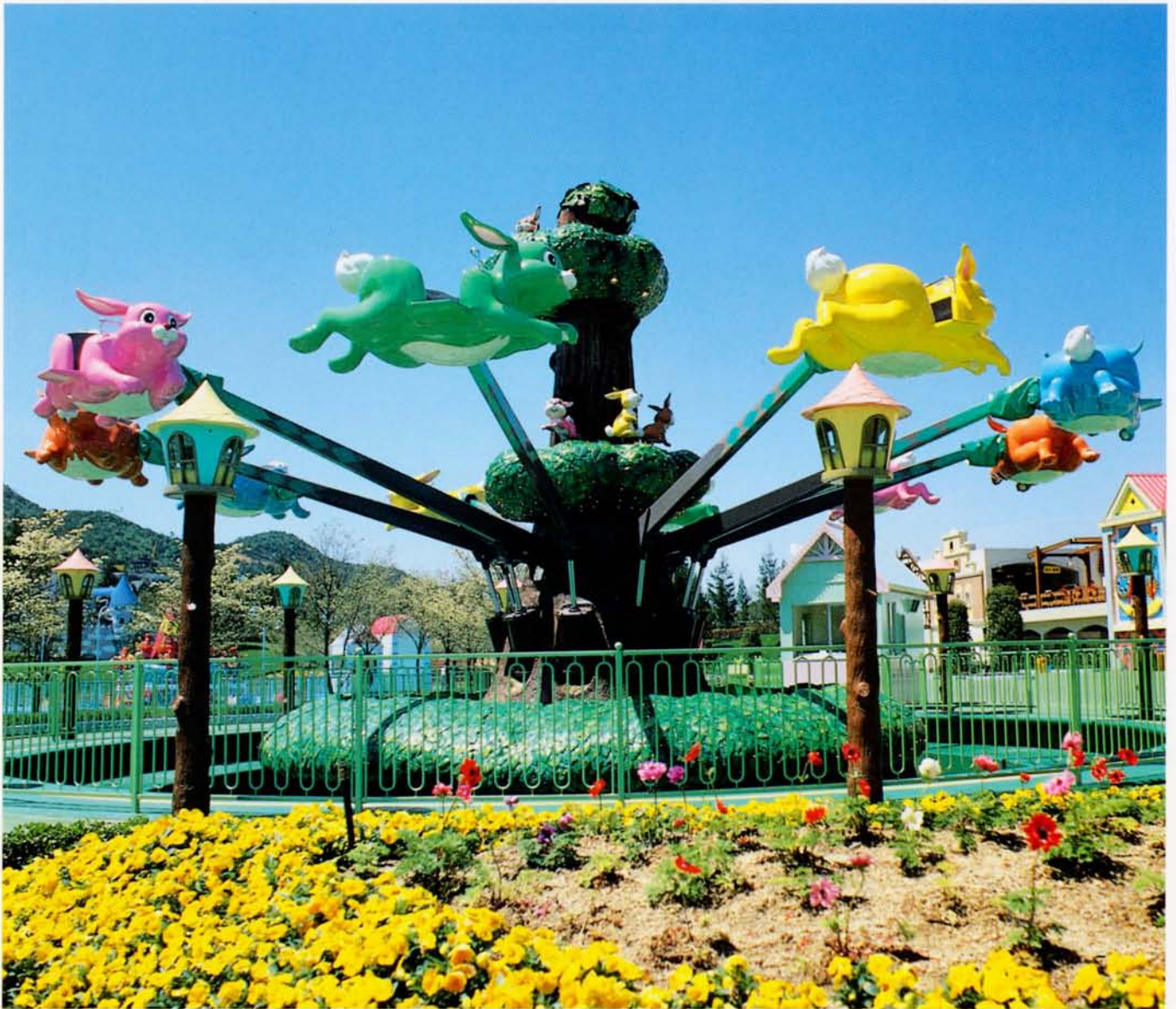
◆ファンシーフライト (レオマワールド)