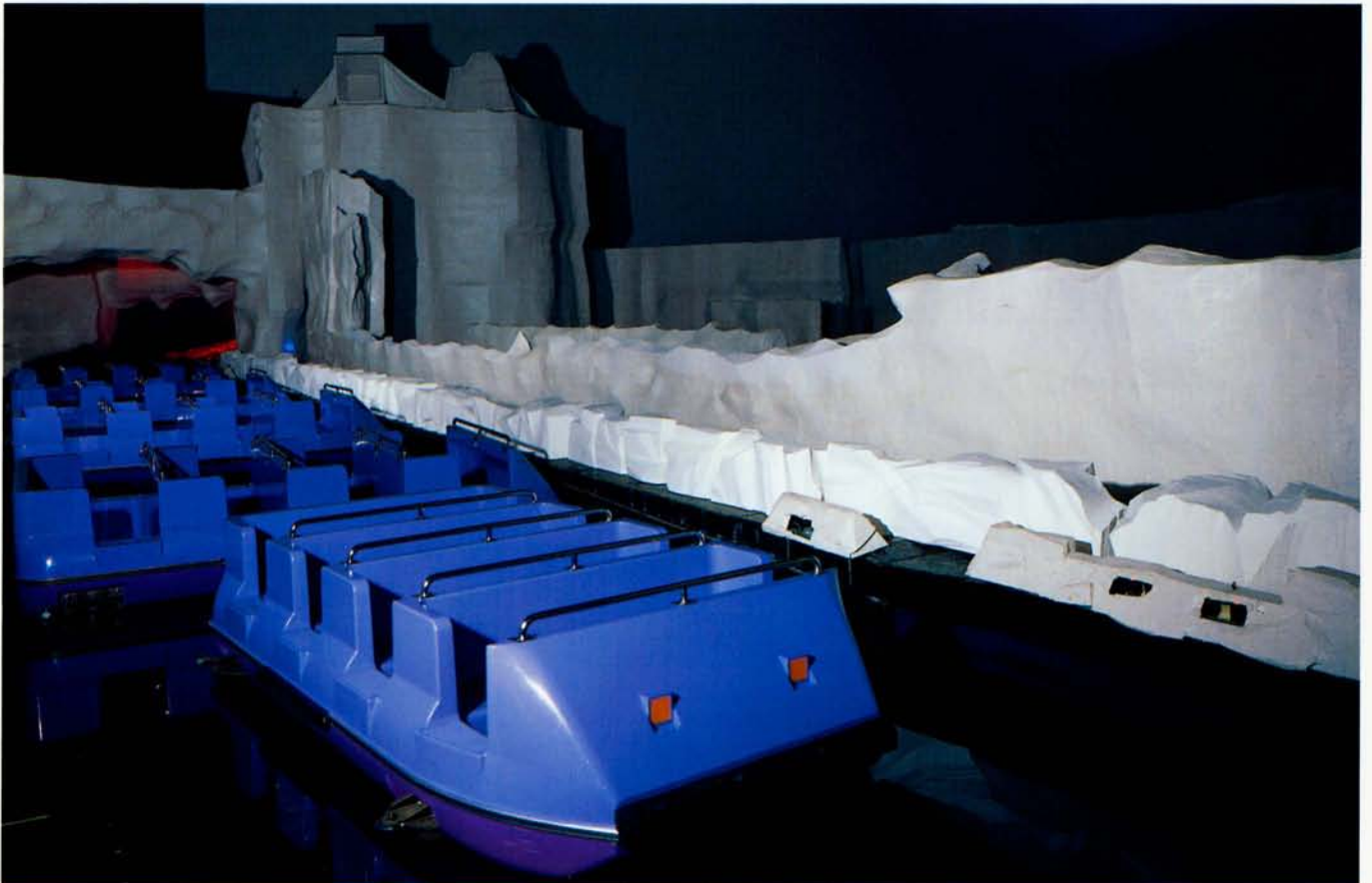
◆フリーズイングシー (レオマワールド)