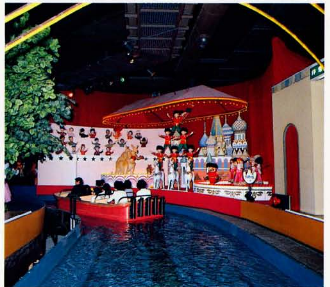
◆大人形館 (宝塚ファミリーランド)