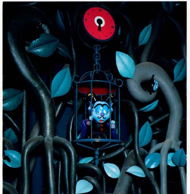
◆レインボーバンディット (レオマワールド)